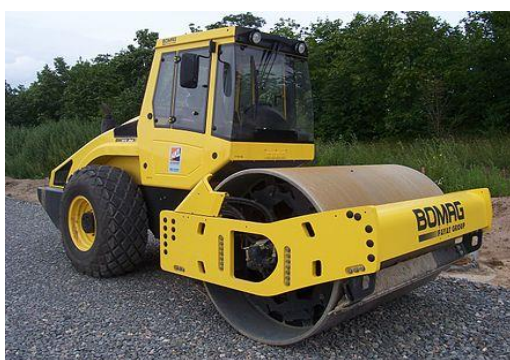
Táto fotografia je chránená licenciou CC BY-SA

4. Dve stavebné firmy zabezpečujú zemné práce pre stavbu diaľnice. Firma Stavbár a.s. by celú úpravu zvládla za 15 dní, firma Cestár s.r.o za 20. Ako dlho budú pracovať spoločne, ak Stavbar a.s. sa do úprav zapojila až vtedy, keď firma Cestár s.r.o už pracovala 6 dni ?